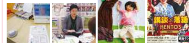
●血管年齢イベント ●似顔絵イベント ●おひるねアート ●楽活イベント