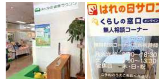
▲シニアに寄り添うための調剤薬局に出店「みんなの健康ラウンジ」